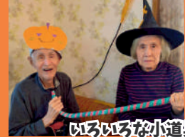
いろいろな小道具も制作