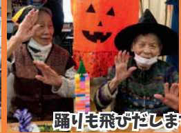
踊りも飛びだします♪