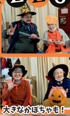
大きなかぼちゃも！