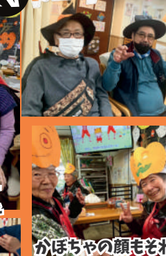
かぼちゃの顔もそれぞれ違います