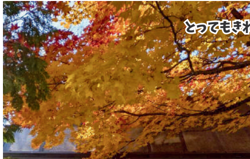
とってもきれいな紅葉を楽しんできました