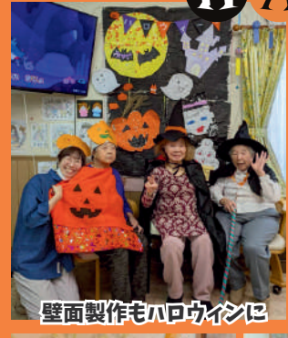
壁面製作もハロウィンに