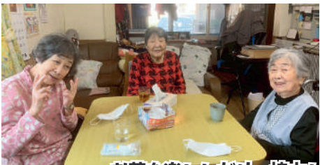
お茶を楽しんだり、協力して問題を解いたり、工作をしたり、それぞれの時間を愉oshimamareteimasu