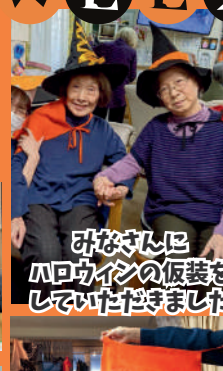
ひなさんにハロウィンの仮装をしていただきました