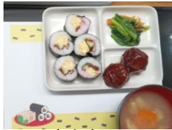
恵方巻風 手作り海苔巻き

季節だけでなく行事を食事からも感じられるメニューを！と考えています。今月は節分とバレンタイン♪