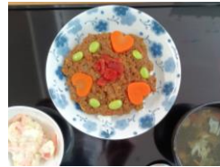
人参のキーマカレー