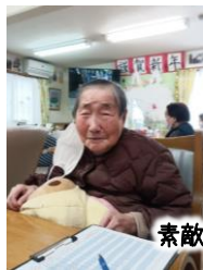
素敵な笑顔があふれています