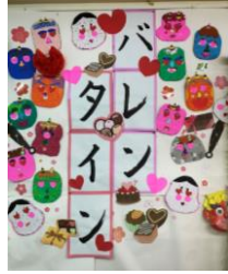
チョコレートデザートで愛のお届けです♡ 鬼は恋をして変身♡