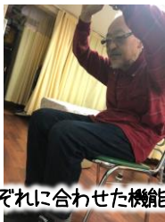
それぞれに合わせた機能訓練