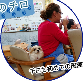
チロも初めての国際交流♪

ホームケアセンター新道東 事業所番号 0170205322 〒065-0031 札幌市東区北31条東16丁目2番9号 ☎ 011-769-9820 FAX 011-769-9821 空き確認はHPへ→ http://www.hiland-home.com