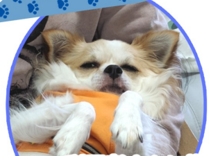
利用者さんに抱っこされて この表情です。 何を考えているんでしょう...